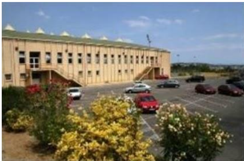
ZONA DE APARCAMIENTO